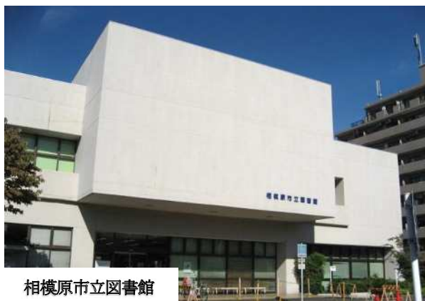
相模原市立図書館