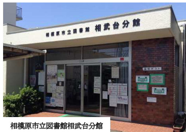
相模原市立図書館相武台分館