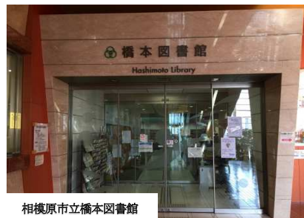
相模原市立橋本図書館