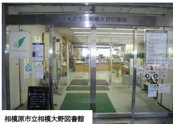
相模原市立相模大野図書館